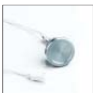
Piezo Schalter - Standard