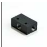
Ventiladapter - 3-fach