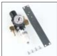
Luftfilter / Wasserabfluss / Druckregler